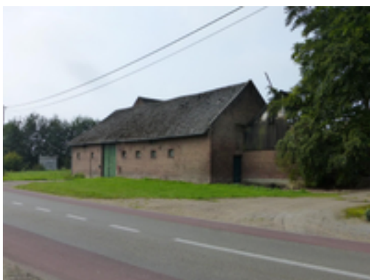
Afbeelding 4: Gesloten hoeve

Semi-gesloten hoeve gevormd door woonhuis (linkervleugel), dwarsschuur (achtervleugel) en stallen (rechter- en straatvleugel) rondom een rechthoekig erf. Langsheen de linkervleugel loopt een doorrit van de voor- naar de achterzijde van het complex, alwaar telkens een poort is voorzien. De straat- en linkervleugel zijn integrale baksteenvolumes, rechter- en achtervleugel behielden vakwerkparamenten aan erfzijde. Pannen zadeldaken dekken het geheel af.