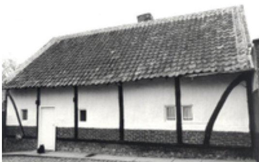
Afbeelding 5: Gesloten hoeve

Gesloten hoeve, uit de 19de eeuw, ietwat achteruit gelegen ten opzichte van de straat. Gebouwen gegroepeerd rondom het rechthoekig erf. Nieuw woonhuis en stallen ten noorden.