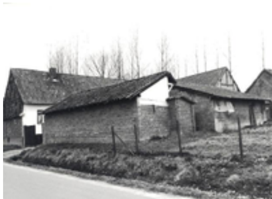
Afbeelding 7: Hoeve met losse bestanddelen

Hoeve met losstaande bestanddelen, uit de 19de eeuw, gegroeid uit een langgerekt hoevetje in stijl- en regelwerk met witgekalkte lemen vullingen op gecementeerde bakstenen stoel, vijf traveeën onder zadeldak (nok loodrecht op de straat, Vlaamse pannen).