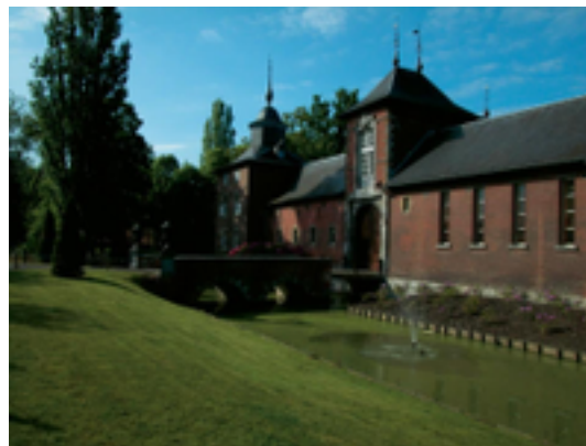
Afbeelding 2: Herkenrodebos en kasteel van Stevoort

Het gebied Herkenrodebos ligt ten zuiden van de