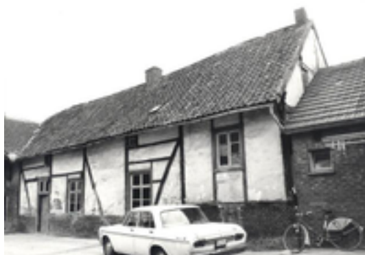
Afbeelding 6: Hoeve Vuileplas

Gesloten hoeve uit de 19de eeuw, met gebouwen in stijl- en regelwerk met blauwgekalkte lemen vullingen onder zadeldaken (Vlaamse en mechanische pannen), gelegen rondom het rechthoekig erf.