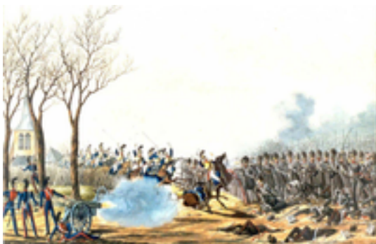
Afbeelding 1: Kermt

Kermt haalde de geschiedenisboeken omdat hier in 1831de Slag bij Kermt gevochten werd tijdens de Tiendaagse Veldtocht, een conflict tussen het piepjonge België en het op revanche beluste Nederlandse leger. De slag nam plaats nabij de abdij van Herkenrode.