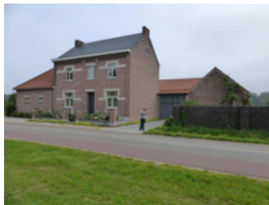
Afbeelding 3: Gesloten hoeve